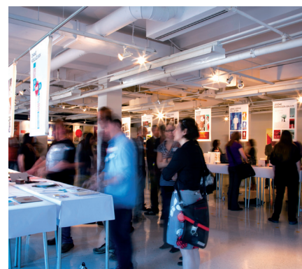
Événement écoresponsable - Exposition de finissants en design graphique.