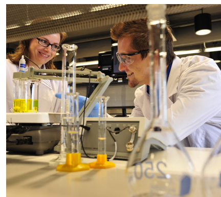
La Faculté rénove ses laboratoires de manière écoénergétique.