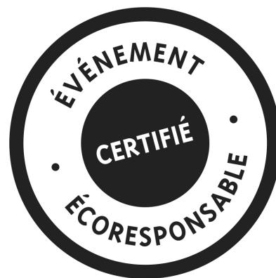
Logo de la certification événement écoresponsable.