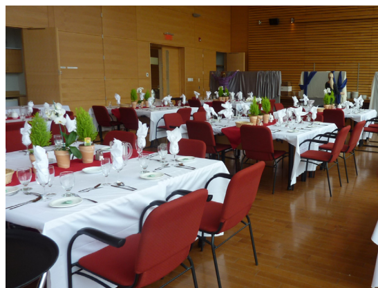
Événement écoresponsable au pavillon Gene-H.-Kruger.