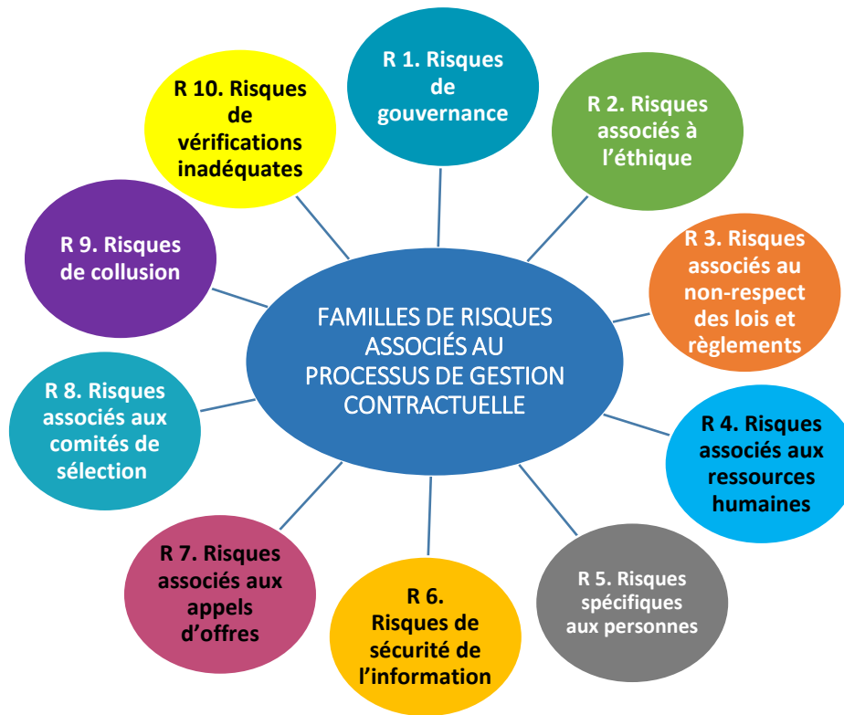
SCHÉMA DES FAMILLES DE GESTION DES RISQUES

Le Plan de gestion des risques décrit également la démarche utilisée pour évaluer et gérer les risques en matière de corruption et de collusion dans les processus de gestion contractuels.