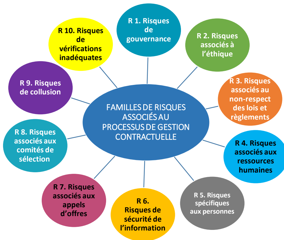
SCHÉMA DES FAMILLES DE GESTION DES RISQUES

Le Plan de gestion des risques décrit également la démarche utilisée pour évaluer et gérer les risques en matière de corruption et de collusion dans les processus de gestion contractuels.